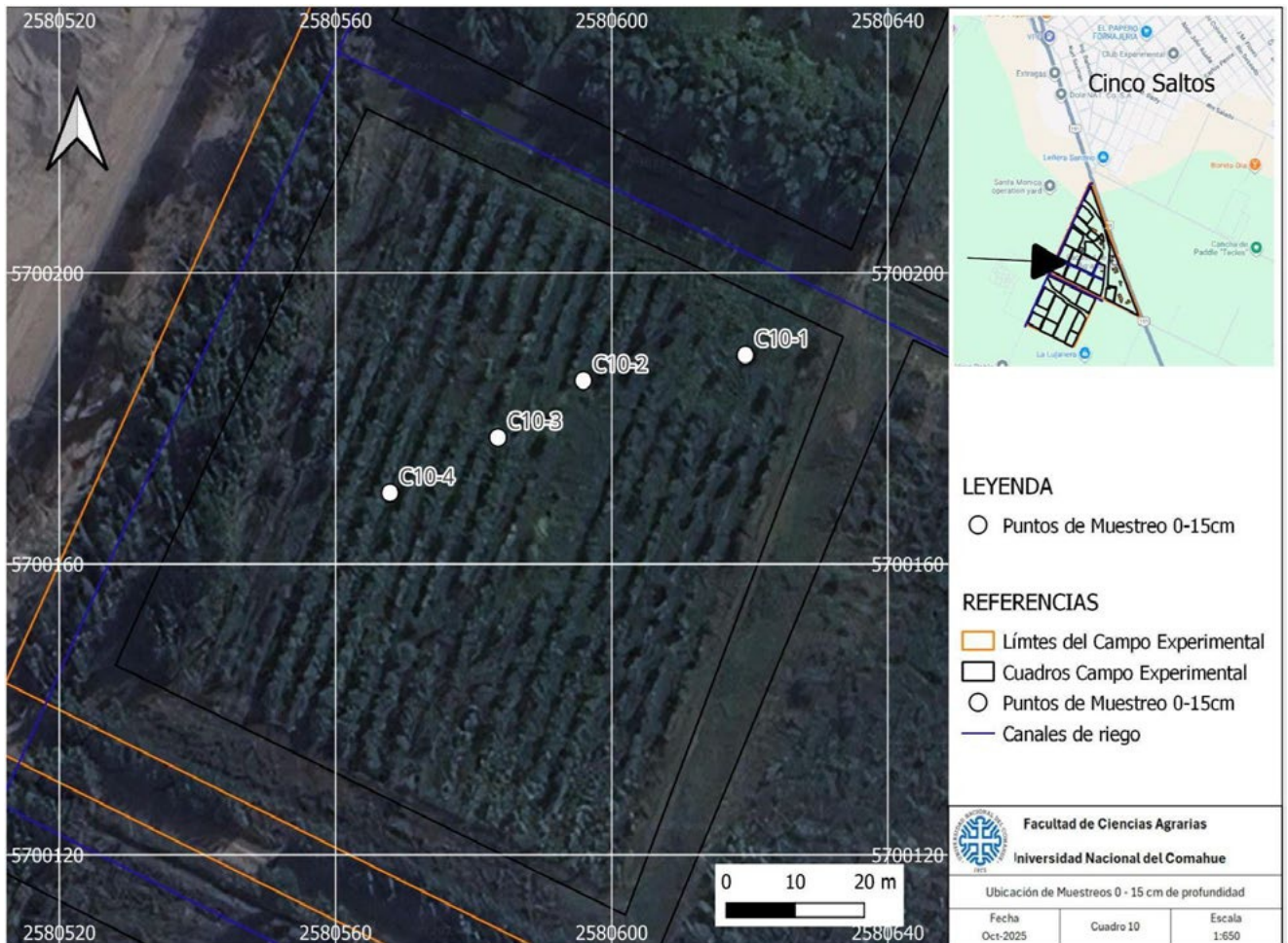
Figura 1. Mapa de localización de Cuadro 10 Sur, resaltando los 4 puntos de muestreo.