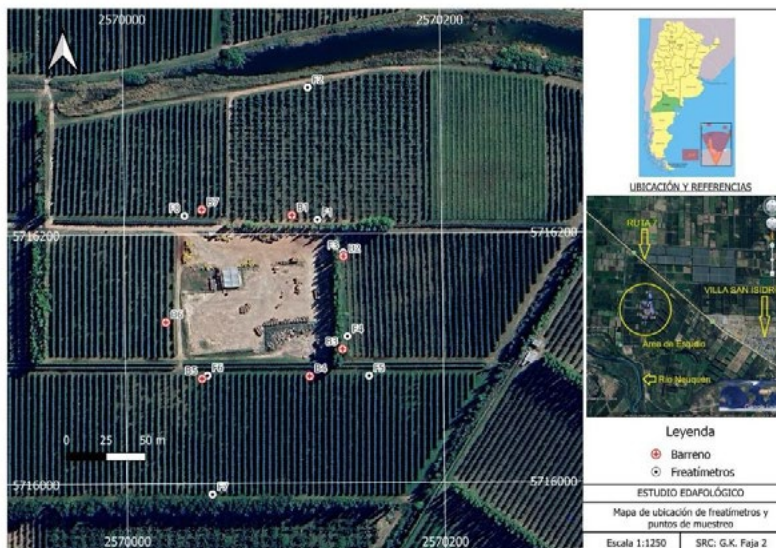
Figura 2. Ubicación de Freatímetros y puntos de muestreo Campo Grande (Rio Negro)

Confección de mapas: Se elaboraron representaciones cartográficas basadas en los datos obtenidos durante la campaña de muestreo. Se utilizó el Sistema de Información Geográfica QGIS y fuentes oficiales de información mencionadas anteriormente.