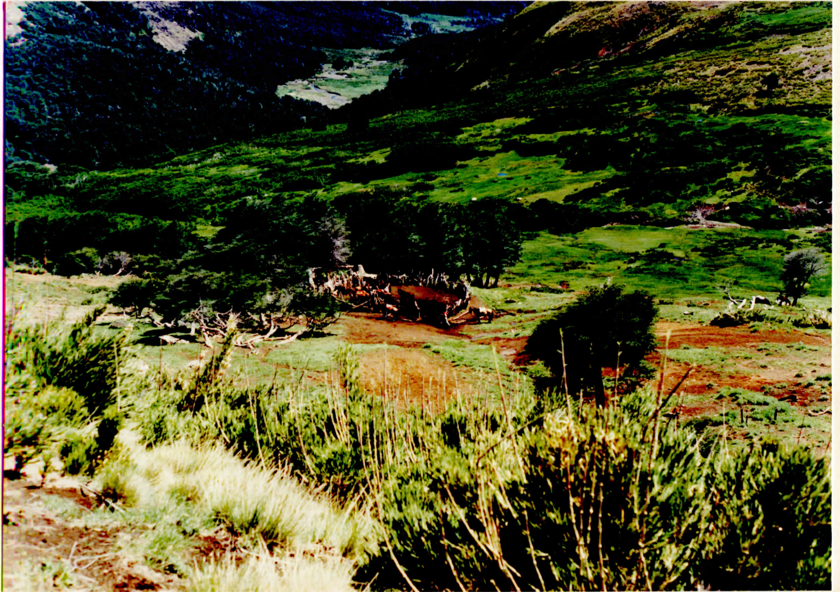
Corral del puesto y Vista de Cajón de Los Barros