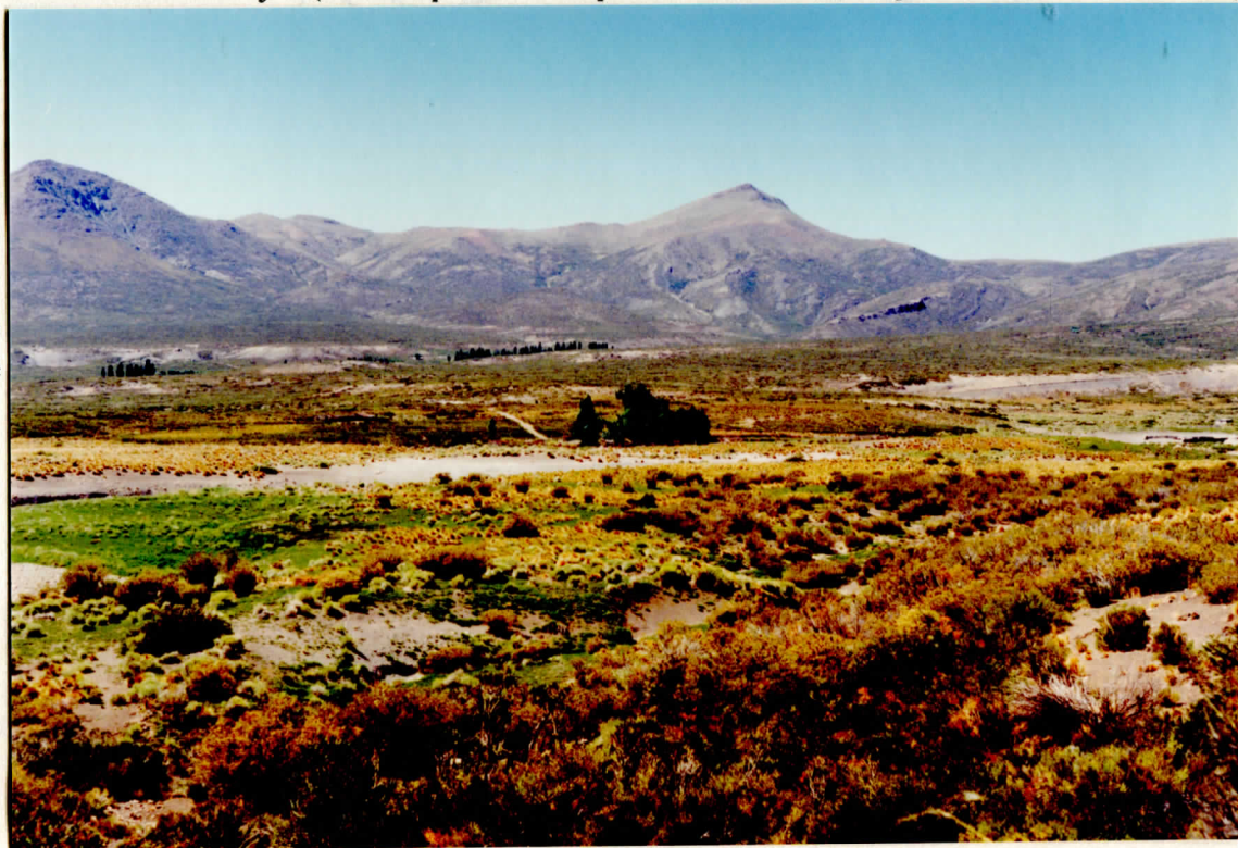
Colipilli . Puesto de invernada

Las dificultades observadas, en especial en este verano , fueron la presencia de predadores: un alto número de zorros y pumas que conspiran con el desarrollo de las actividades productivas. Estas actividades son prácticamente de subsistencia. Un escaso porcentaje de aborígenes produce para la venta, a parte de ganado, tejidos de ponchos, fajas, ma