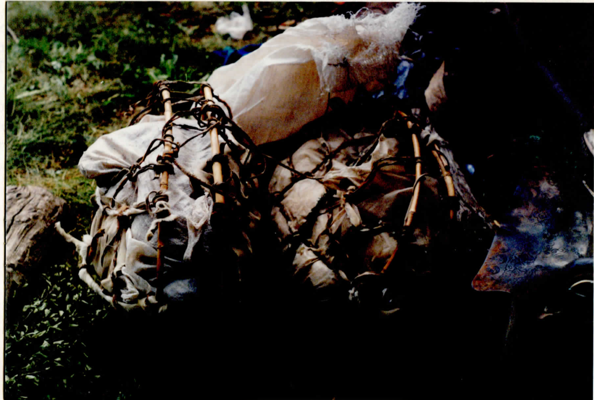
Par de chihuas

La movilización comienza. Los arrieros a caballo con un animal (puede ser caballo o mula llamada la carguera ) que lleva los objetos cotidianos: ollas, harina, pan, carpa para la lluvia, frazadas, poncho etc. . Para hacerlo disponen de un objeto de tecnología popular, ancestral: hablamos de la chihua o chigua 2