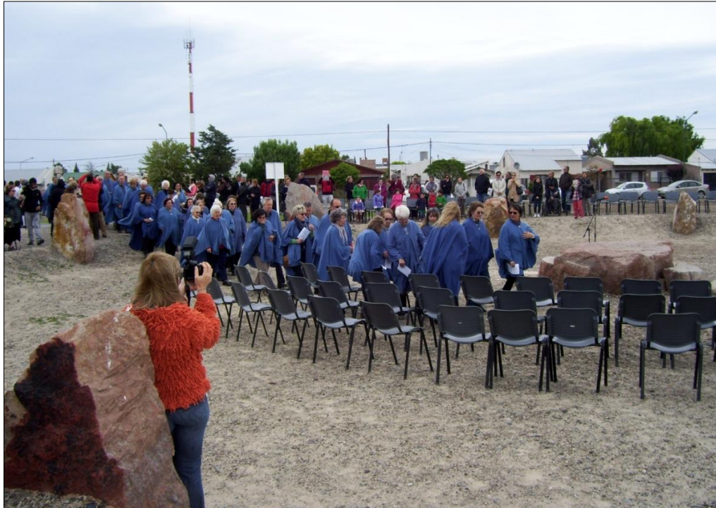
Fotografía tomada en Gaiman, 25 de octubre de 2012.