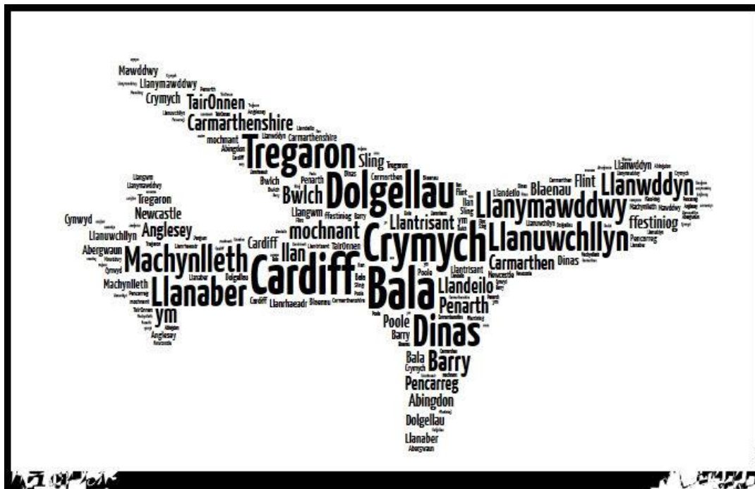
Ilustración 2: ciudades de procedencia de los turistas encuestados.