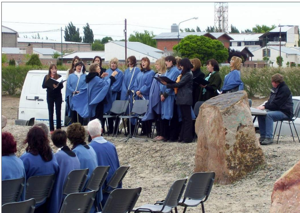
Fotografía tomada en Gaiman, 25 de octubre de 2012.