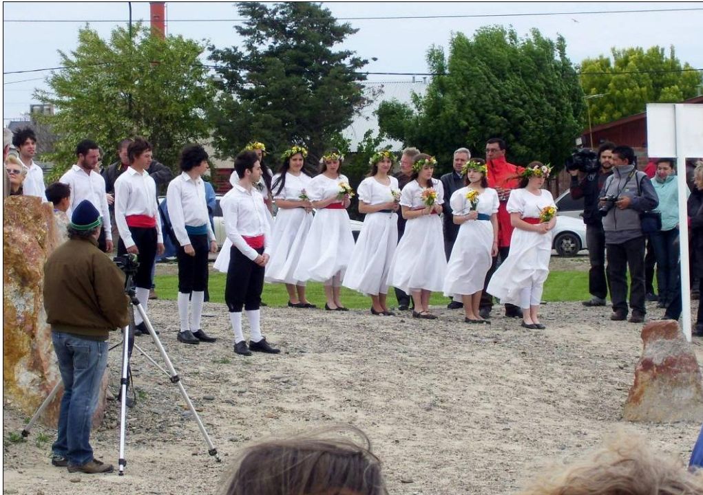
Fotografía tomada en Gaiman, 25 de octubre de 2012.