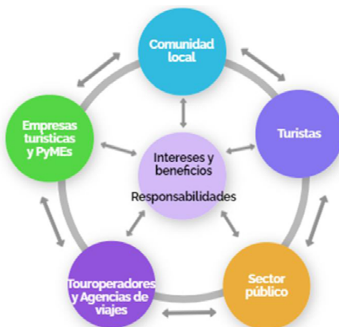
Imagen N°1. Rueda dinámica de los actores del destino turístico.

En cuarto lugar, los territorios turísticos contienen diferentes usos por parte de las y los turistas, las y los agentes económicos, las comunidades locales y las y los gestores públicos. Por lo cual, cuando hablamos de territorios turísticos, reconocemos el proceso de integración social que se da en ellos, con las diversas dimensiones materiales y subjetivas de sus actores. Estos grupos de interés establecen relaciones buscando satisfacer intereses y beneficios particulares a la vez que generan responsabilidades (Buhalis, 2000). En definitiva, los diferentes actores tienen intereses respecto a la actividad, y se benefician o no de la misma, de manera heterogénea. Buhalis (2000) representa esta situación en la Figura N°1.