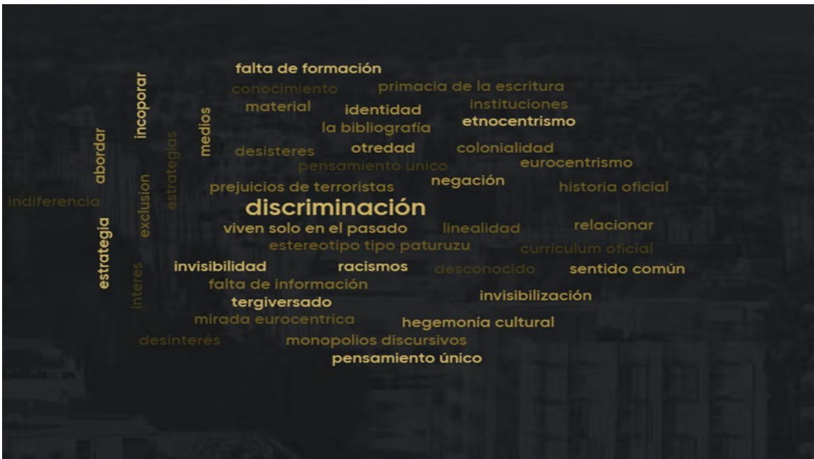
Figura N° 2 Dificultades que identificas en el tratamiento del pueblo Mapuce en las clases de Historia

Nota: Nube de palabras construida a partir de la participación del profesorado.