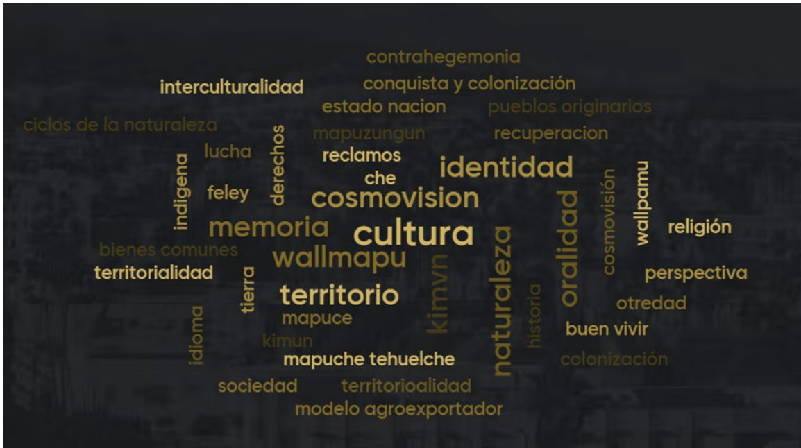
Figura N° 1 Palabras claves sobre la enseñanza del pueblo mapuche

Nota: Nube de palabras construida a partir de la participación del profesorado.