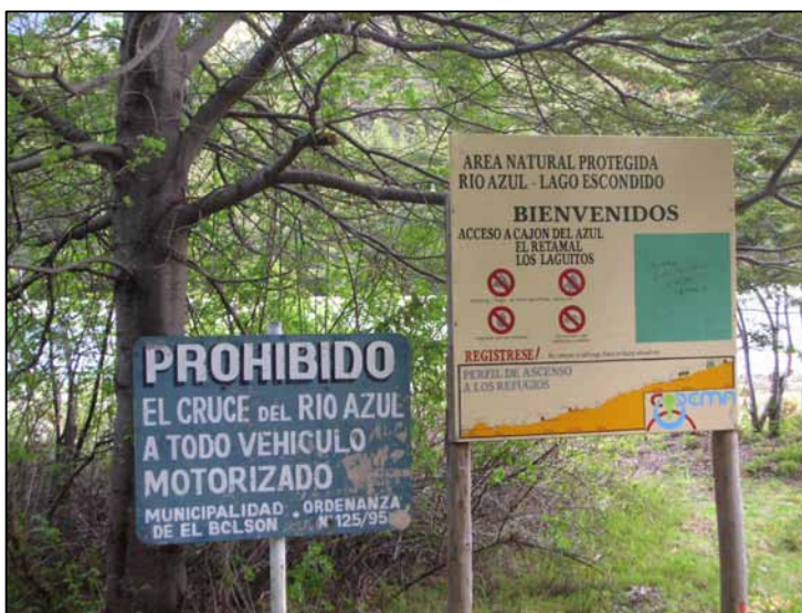
FOTOGRAFÍA N° 6. CARTELERÍA ÁREA PROTEGIDA RÍO AZUL – LAGO ESCONDIDO

El segundo refiere al mercado turístico y la elección de los destinos turísticos donde realizar inversiones económicas, de esta manera se pondera la imagen y el posicionamiento turístico del municipio de El Bolsón y de la zona en si. Los inversionistas se ven atraídos por invertir en circuitos turísticos creíbles y reales, que motivan la visita de miles de personas año a año 68 . En la siguiente fotografía se observa el acceso al Área Protegida y la señalización respecto a los senderos y atractivos que pueden visitarse.