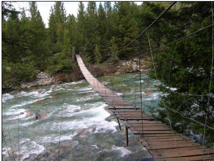
FOTOGRAFÍA N° 5. PASARELA SOBRE RÍO AZUL.

En los casos donde se encuentren lagos y ríos navegables íntegramente dentro de una propiedad privada, el Código Civil refiere a los mismos como bienes del “ dominio público debiendo el propietario soportar una servidumbre de paso para el acceso público al espejo y sus márgenes ” 49 .