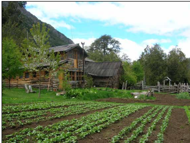
FOTOGRAFÍA N° 9. PLANTACIÓN DE HORTALIZAS EN REFUGIO “CAJÓN DEL AZUL”

Un dato importante a remarcar es que los compradores esporádicamente violan la legislación nacional en las operaciones de compra y venta de tierras. Es decir, el comprador no comete delitos gracias a que las autoridades facilitan que dichas las adquisiciones se den dentro del marco legal.