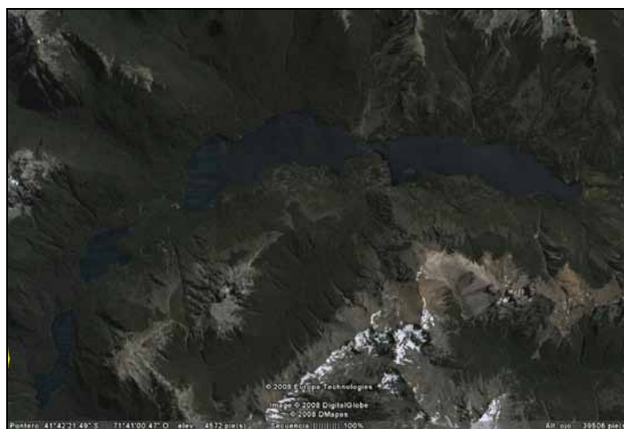
FOTOGRAFÍA N° 1. LAGO ESCONDIDO, EL BOLSÓN