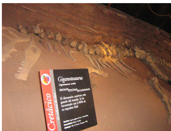
Cartelería informativa *