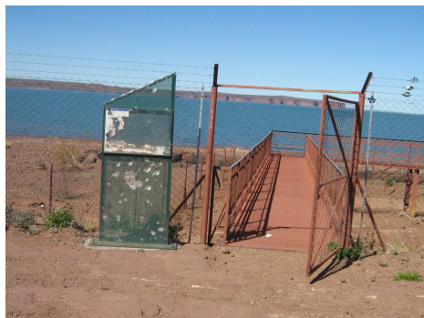
Soledad Alem – Sept 2008

En cuanto a la demanda de Villa El Chocón, la Dirección de Turismo Municipal realiza el control de la cantidad de visitantes que reciben diariamente mediante el puesto de información que posee en el acceso a la localidad y encuestas que los informantes realizan en la Villa.