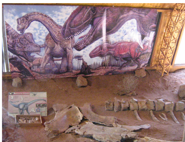
Sala de exposiciones*