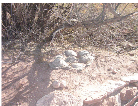
Fósiles de huevos-parada en el circuito*