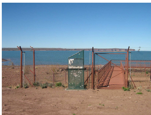
Acceso a pasarela sobre las huellas – soporte de cartelera*

Para llegar al sitio donde se encuentran las huellas no hay señalización en los accesos; por lo tanto, si no se conoce el lugar, indefectiblemente se debe consultar en la oficina de informes o a algún residente. El sector se encontró muy deteriorado y descuidado. La cartelera ya no existe (solo su soporte), había basura en los alrededores y próximas a las huellas de dinosaurios se observaron huellas de personas. Tanto la barrera de contención como las pasarelas que las protegen son fácilmente traspasables, lo que incita a los visitantes a acercarse “mas de lo permitido” a la huella y obtener, por ejemplo, una fotografía comparativa de su huella con la del dinosaurio.