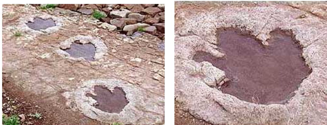
Vista de las Huellas***