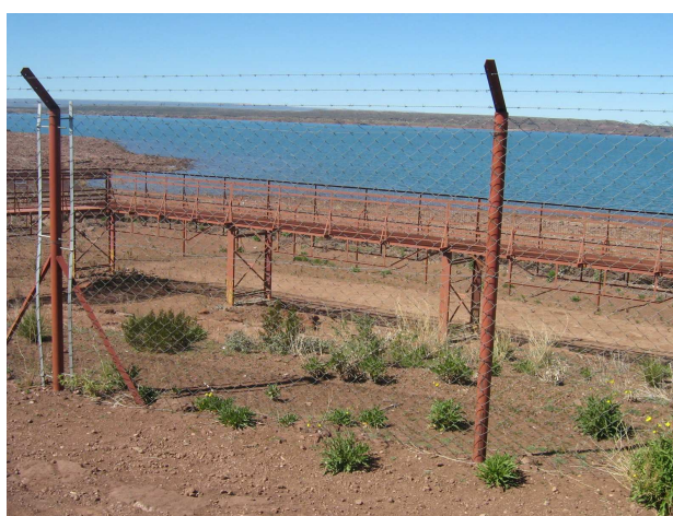
Sistema de pasarelas y alambrado*