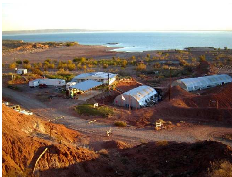
Centro Paleontológico Lago Barreales hoy**.

En el Yacimiento Paleontológico se han recuperado hasta hoy, varios centenares de piezas fósiles de vertebrados y restos vegetales, que conforman un registro de un ecosistema casi completo del Mesozoico. Se han recuperado alrededor de 1100 piezas fósiles de vertebrados y alrededor de 300 restos vegetales. También se han recuperado restos de moluscos bivalvos de agua dulce.