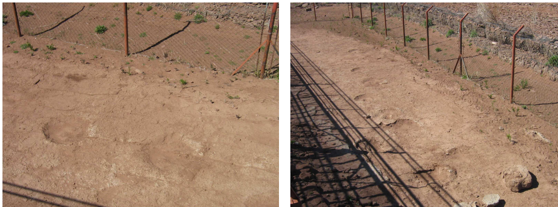
Distintos puntos panorámicos de las Huellas*

Otro atractivo de Villa El Chocón importante para este trabajo es el sector en que se hallaron huellas de dinosaurios de una antigüedad aproximada de 100 millones de años, ubicado en la costa noroeste del lago Ezequiel Ramos Mejía. Tiene 10 metros de ancho y 500 metros de longitud que está protegido con una pasarela metálica que permite la conservación e interpretación de las huellas.