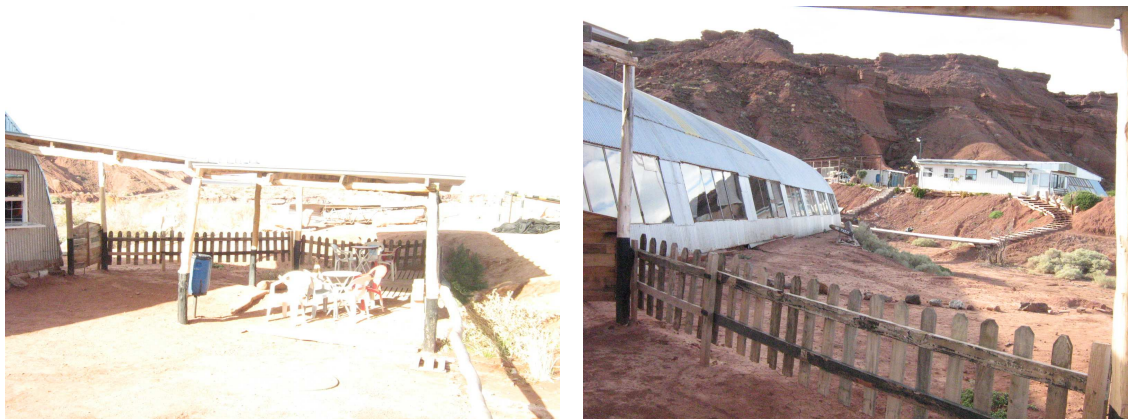
Sala de exposiciones. Hacia la derecha sector exclusivo del equipo técnico.

Sector con mesas y sillas para la espera de los visitantes