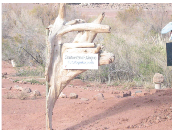
Comienzo del recorrido*