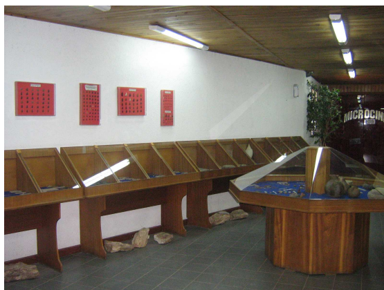
Vitrinas de exposición *

A continuación se presentan imágenes del interior del museo.