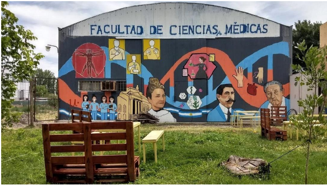
- Imagen 09. Mural finalizado-