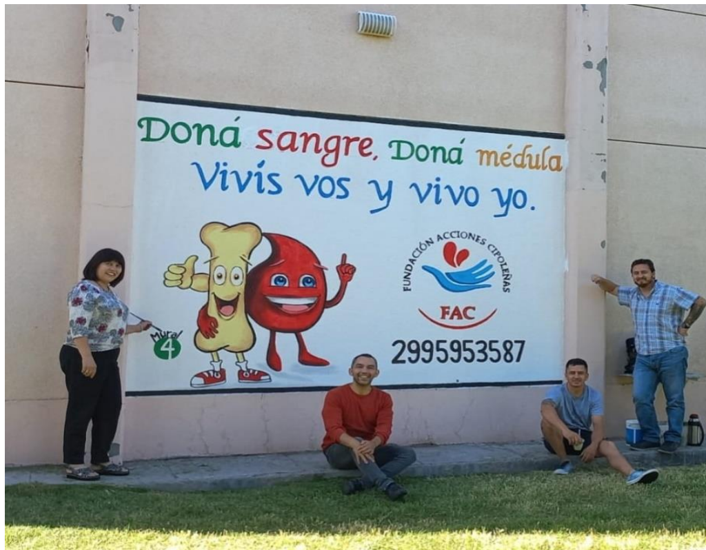
- Imagen 14. Mural FAC-