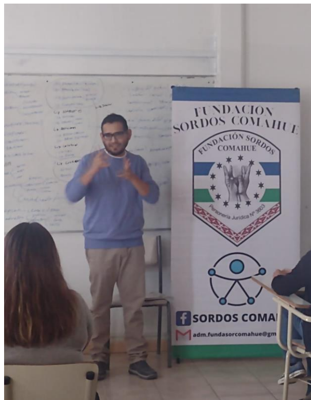
- Imagen 12. Capacitación LSA FaCiMed-