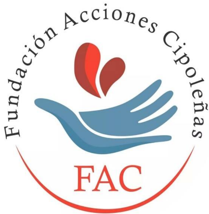
- Imagen 13. Logo FAC-