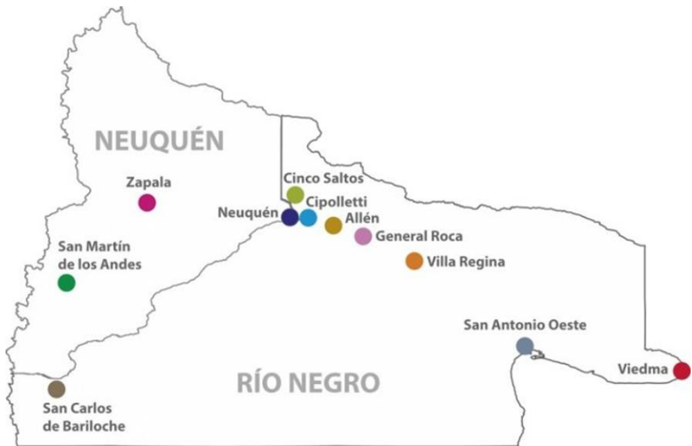
- Imagen 03. Mapa sedes UNCo-