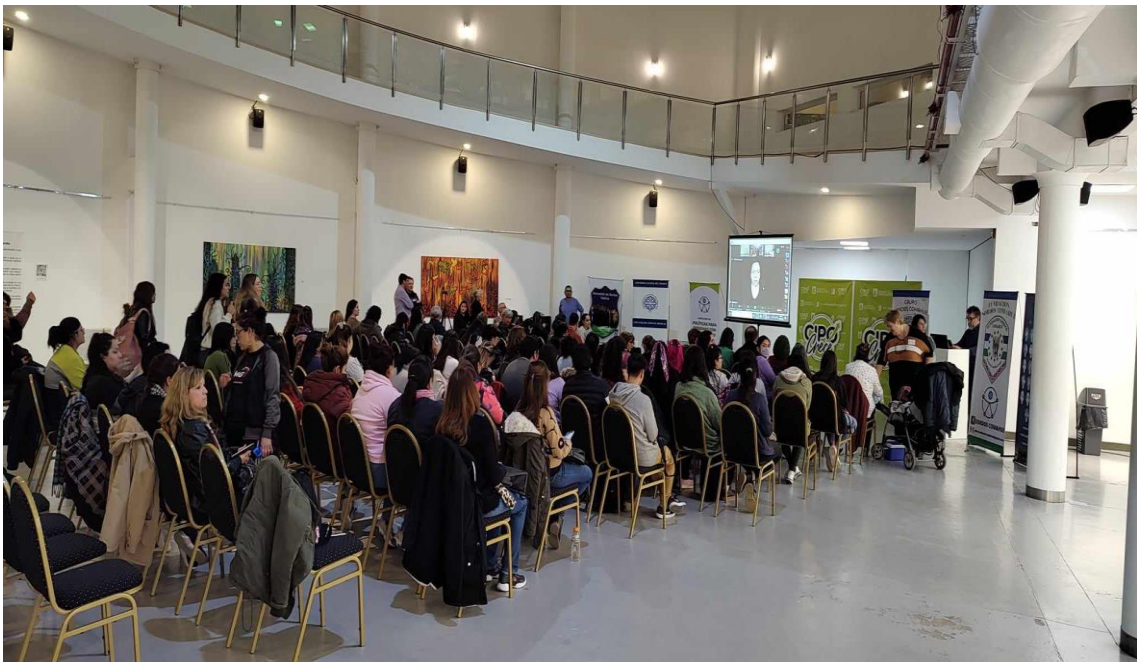
- Imagen 17. Charla Buenos Tratos-