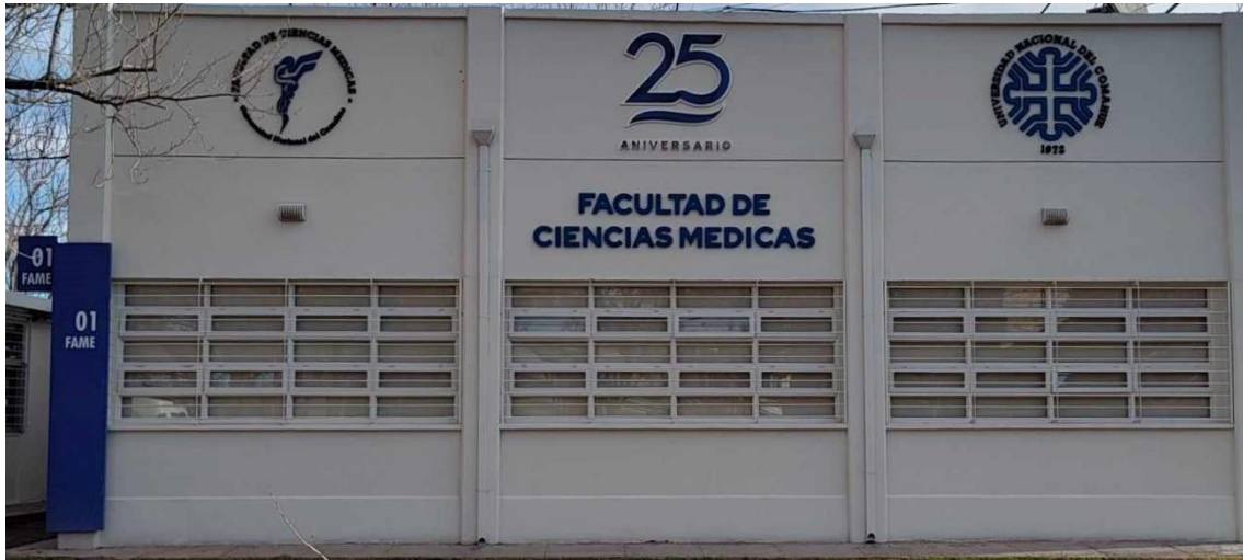
- Imagen 01. Acceso principal FaCiMed –