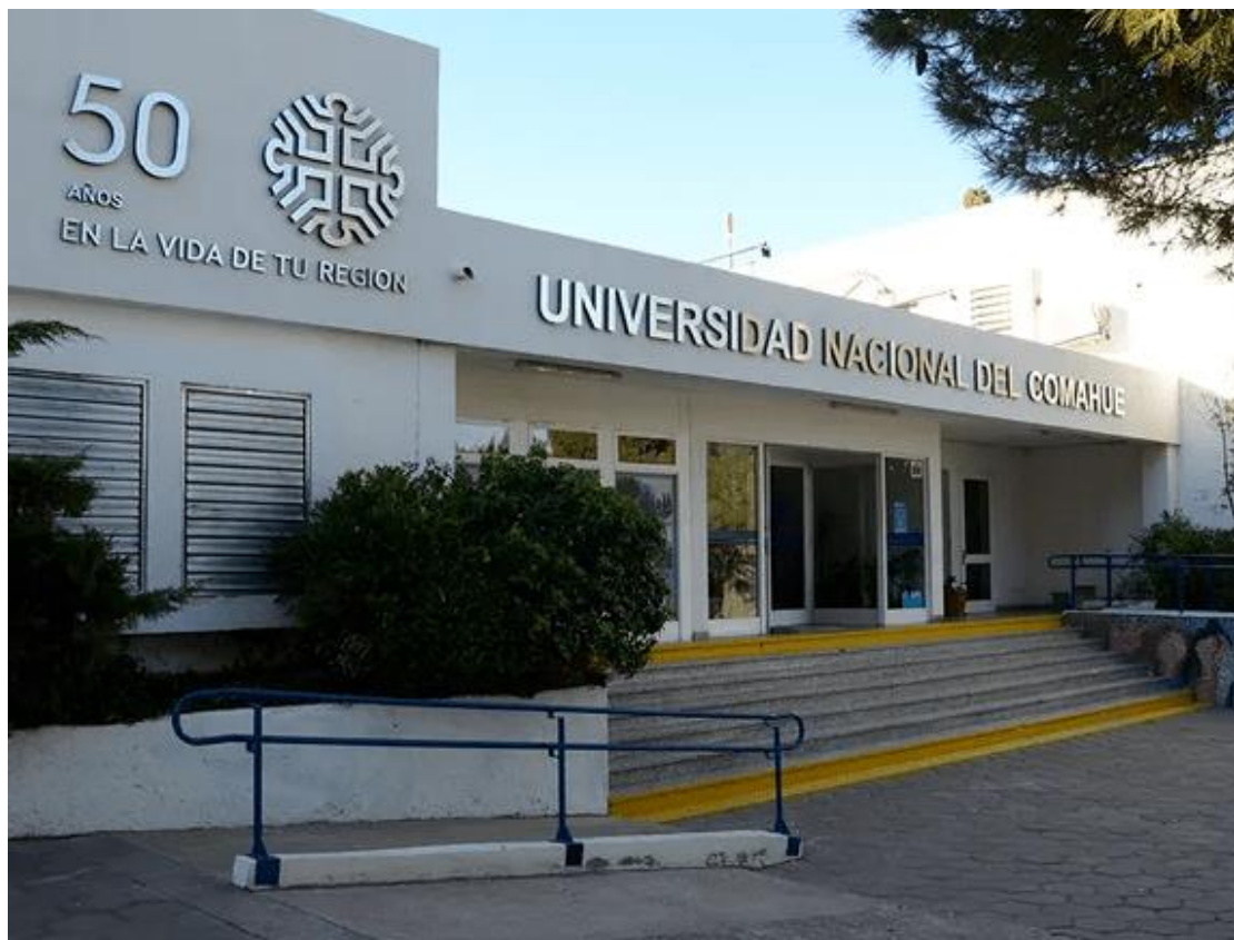
- Imagen 02. Acceso principal UNCo-