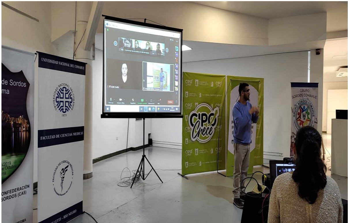
- Imagen 16. Charla Buenos Tratos-