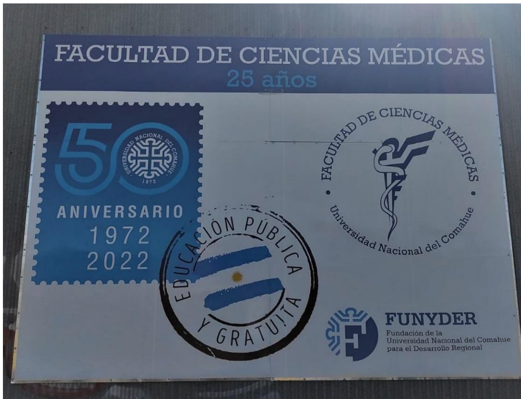
- Imagen 10. Cartel 50 años UNCo y 25 FaCiMed-