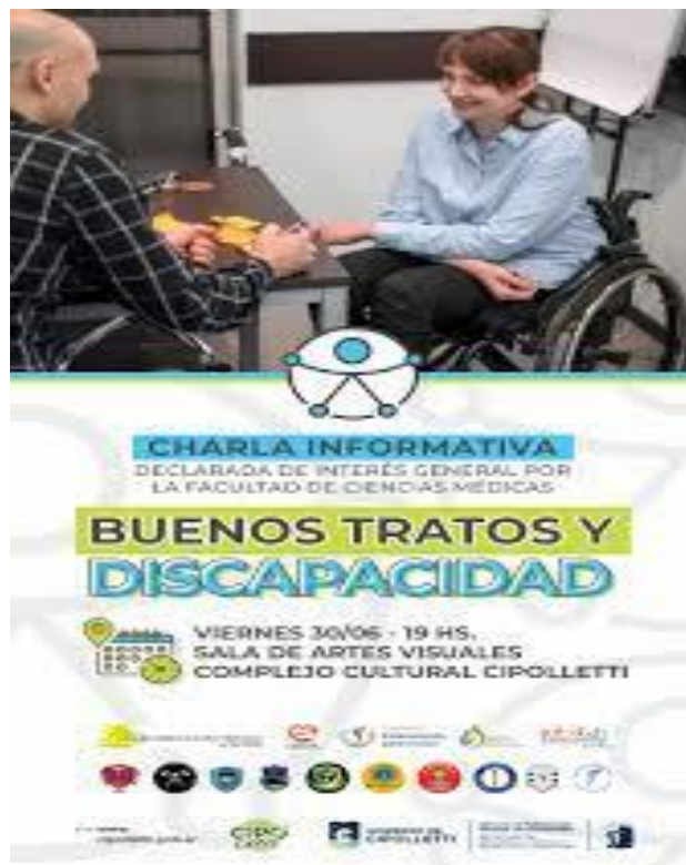
- Imagen 15. Invitación "Charla Buenos Tratos"-