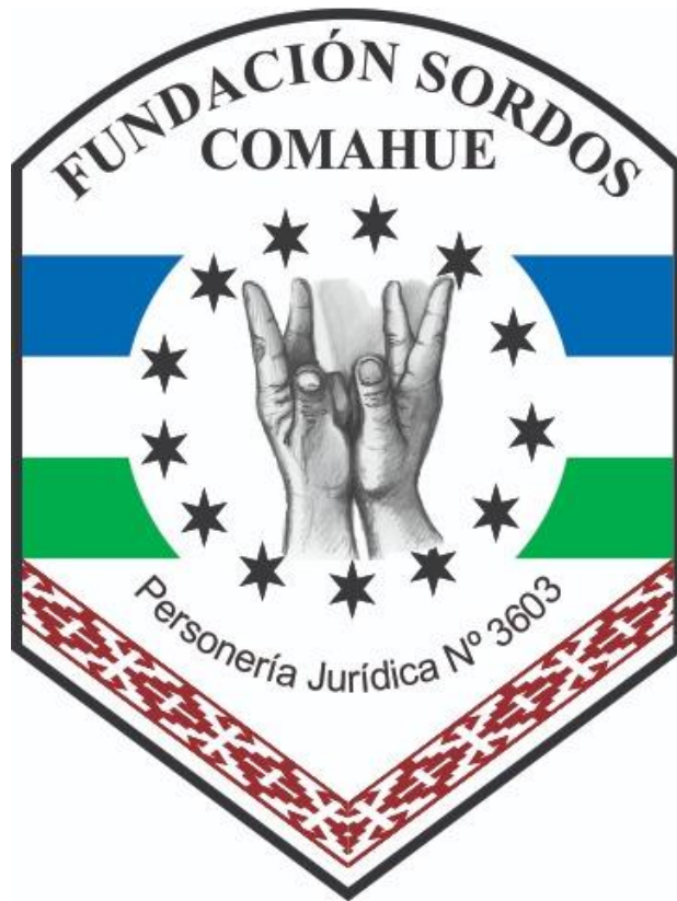
- Imagen 11. Logo Fundación Sordos Comahue-