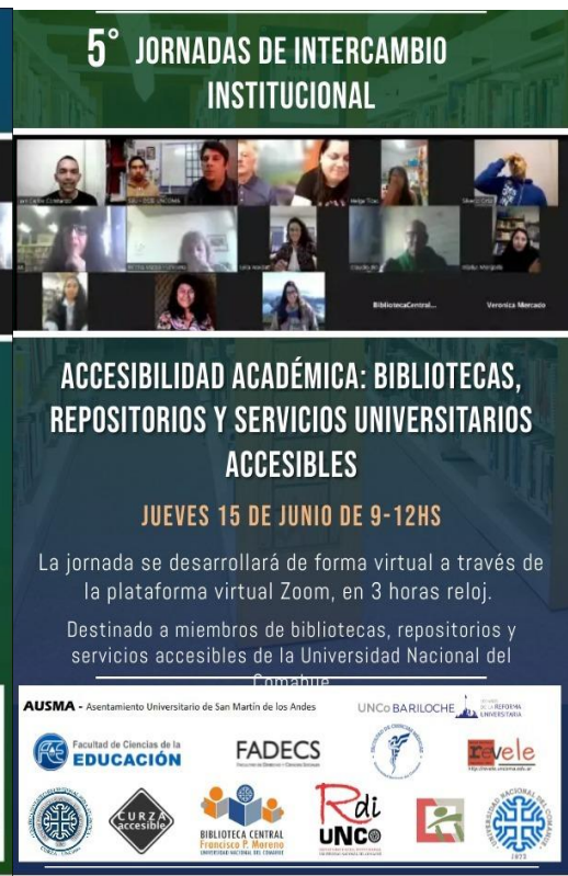
- Imagen 18. Jornadas Bibliotecarios/Accesibilidad-