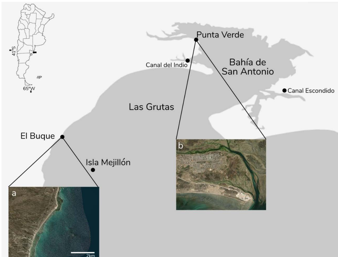
Mapa del área de estudio mostrando el área de exploración y los lugares en los que se halló a Pleurobranchaea maculata (a. Punta Verde y b. playa El Buque)