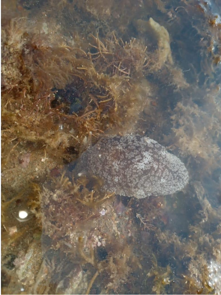
Figura 2. Ejemplar de Pleurobranchaea maculata en la playa Punta Verde.