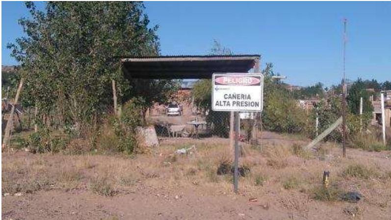
Imagen 1: carteles de peligro en veredas del barrio