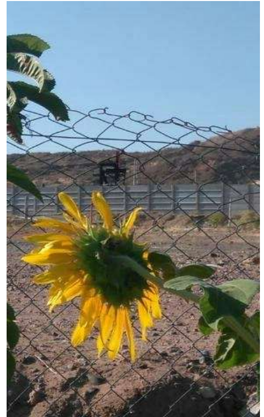
Imagen 3: patio de una vivienda