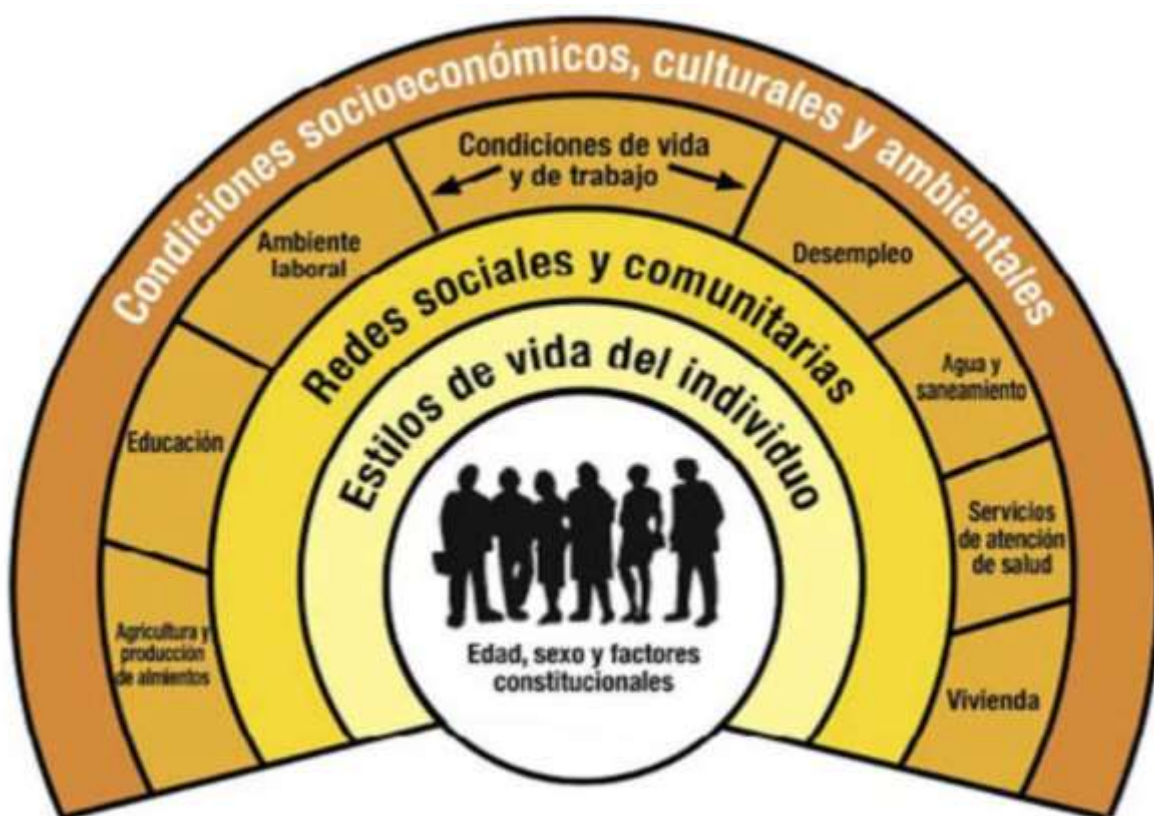
Figura 1: Modelo de Determinantes de Salud

Otro de los modelos, es el propuesto por Dahlgren y Whitehead (1992), citado en Moiso (2007) plantea que, a partir de la estratificación social presente en un contexto social, se determinan las oportunidades en salud. Este modelo (Figura 1) refleja que el contexto político y el contexto social influyen en la posición social de las personas, exponiendo de manera diferenciada a factores ambientales, psicosociales, culturales y modos de vida que generan consecuencias en la salud de la población.