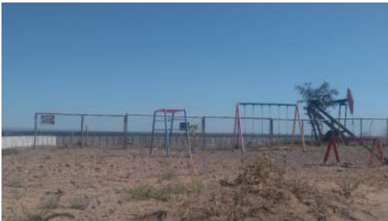
Imagen 2: carteles de peligro en plaza del barrio

Percepciones que poseen del Proceso salud-enfermedad las personas del barrio Valentina Norte Rural sector Los Hornos viviendo en cercanías a pozos de extracción de hidrocarburos