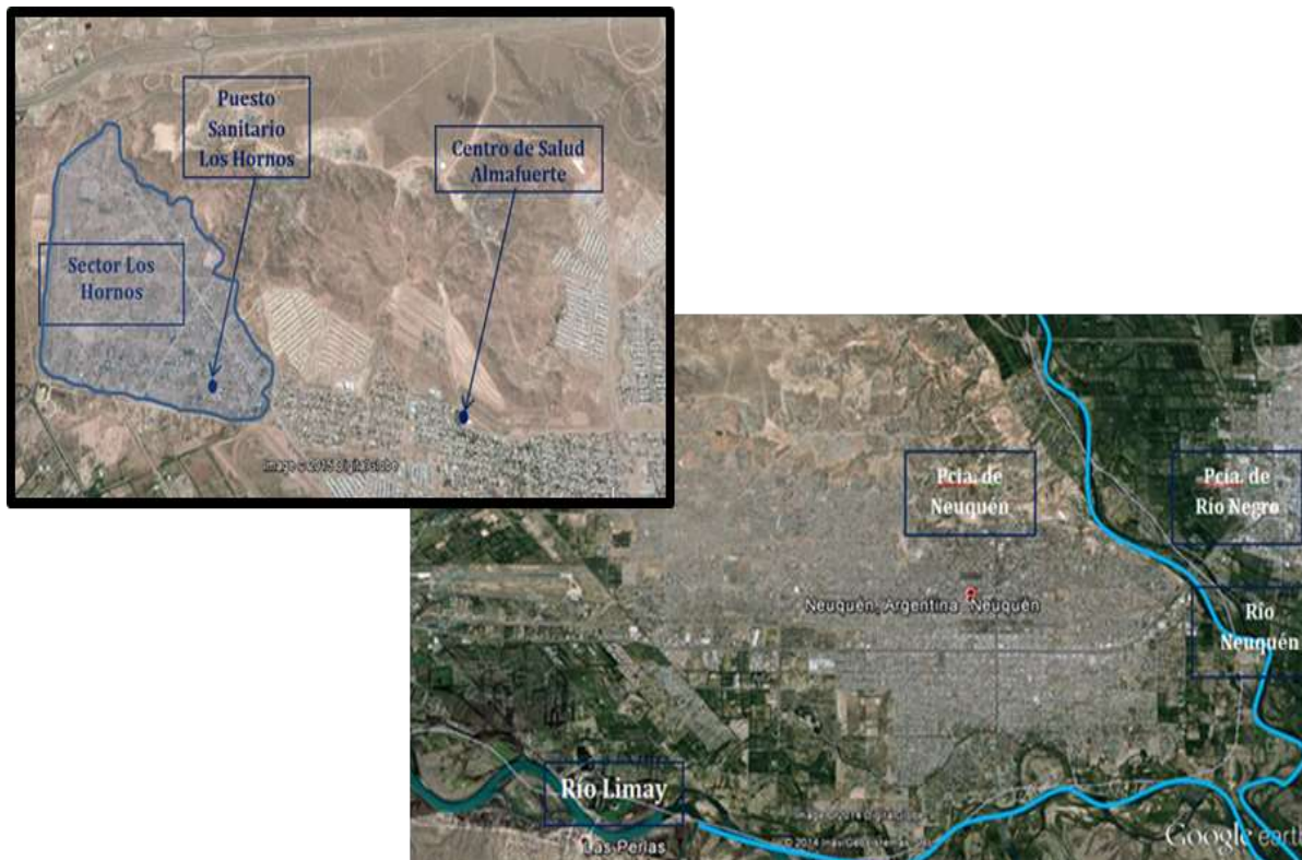
Figura 4: Mapa de la ciudad de Neuquén y ubicación del área de estudio

Los Hornos (Figura 4) se ubica al norte de la ciudad, ocupa una superficie 121 has, dentro del barrio Valentina Norte Rural, en el límite con Plottier. Mientras el aeropuerto y el ferrocarril son la línea divisoria entre el norte rural y el urbano, la ruta nacional 22 actúa como separación entre las regiones norte y sur. Al mismo tiempo, en el norte rural en la zona “Los Hornos” las picadas petroleras generan nuevas particiones. Allí conviven con los pozos gasíferos e infraestructura asociada del yacimiento Centenario, explotado desde 1977 por la empresa Argentina Pluspetrol. En su límite oeste, se encuentra la transitada calle Río Colorado que conecta el Parque Industrial de Neuquén con la ruta nacional 22 (OPSur, 2015).