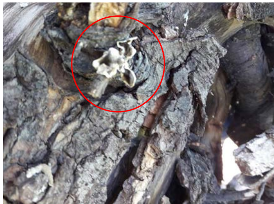
Fig. 3. Pilas de tocones ubicadas entre las plantas afectadas. B. Basidiocarpo en madera muerta entre los tocones.