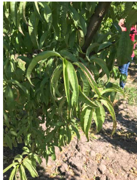
Fig. 1. Follaje de tonalidad plumiza, hojas plegadas con bordes necróticos.

En una plantación de durazno var. Diamon Prince se observó alta incidencia de “mal del plomo” (Fig. 1) y se habría registrado también en manzanos Galaxy sobre portainjerto MM111, situados en Colonia Julia, zona de Río Colorado. Además, en esta temporada, también se registraron dos casos en el Alto Valle de Río Negro, en plantaciones jóvenes de cerezo y almendro.