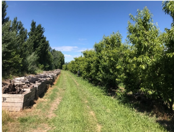
Fig. 5. Prácticas de manejo de control de heladas por quema de leños de frutales en Río Colorado.