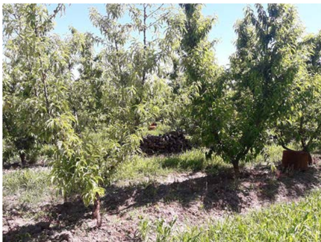
Fig. 2. A-E. Evolución de síntomas de la enfermedad “mal del plomo” en Prunus persica var Diamon Prince. A. Detalle de hojas con color plateado. B. Rama con hojas afectadas de coloración gris plomizo y aspecto clorótico. C. Follaje plateado con curvatura de las hojas hacia arriba. D. Planta con una rama con síntomas (atrás) y otra asintomática (adelante). E. Planta debilitada y totalmente afectada, con coloración plomiza en todo el follaje (D y E. Fotos cortesía de Mariela Arce y Susana Pilatti, estudiantes de Ingeniería Agronómica de la UNCo).